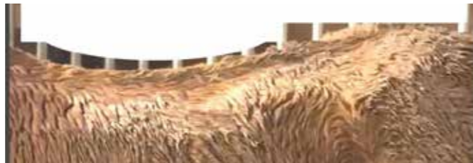
Endnu en af de tynde heste fra de mange sager.

Vi har haft en del sager om tynde heste, hvor ejerne ikke kan se problemet og ikke agter at gøre noget ved det. Her bliver ejerne i så fald politianmeldt.