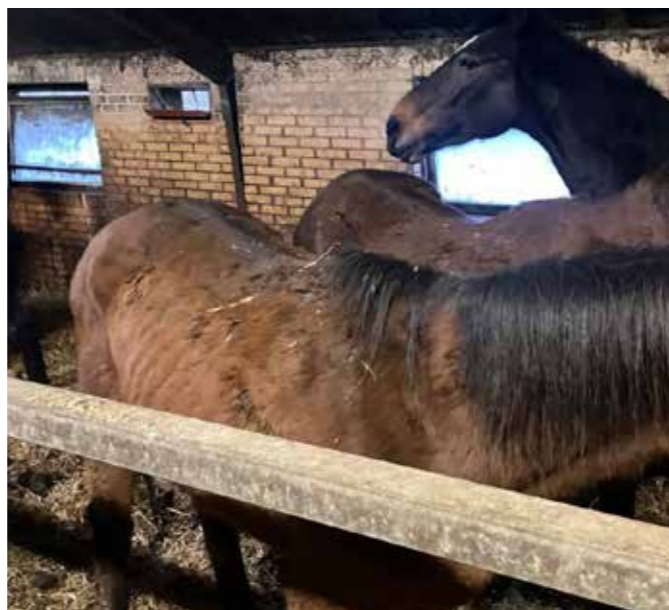
Hestene er alt for tynde.

Det er ufatteligt, at stedet ikke lukkes ned for bestandig og aldrig burde genopstå igen. Der er kun en taber her, og det hestene!