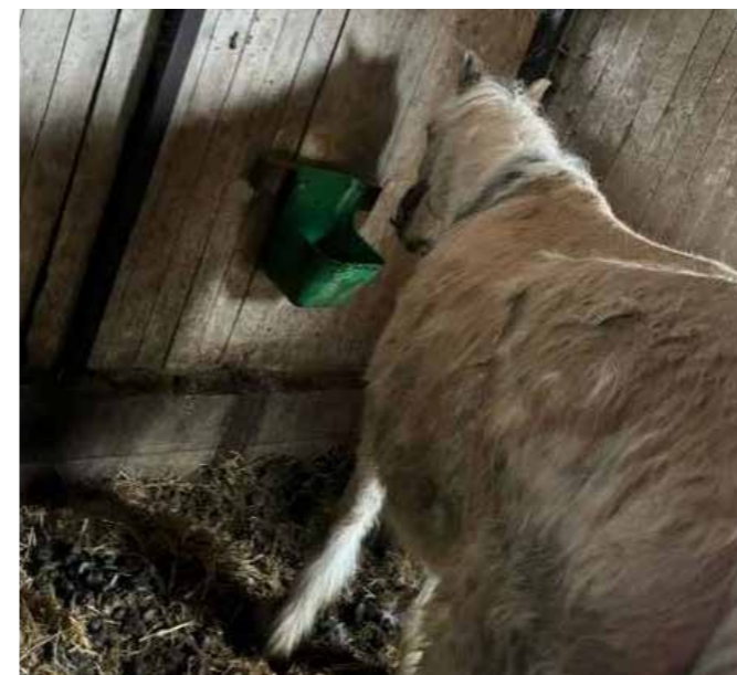
En tynd fjordhest fra en af vore sager

Vi har flere sager med snabelhove, hvor det oftest ender ud i en politianmeldelse.