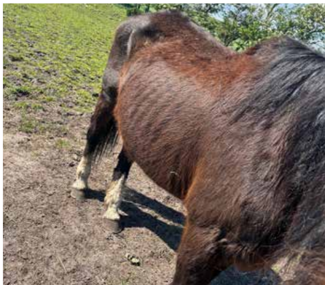
En af de tynde heste fra de mange sager.

Nyt Hesteliv har fået mange henvendelser i det for-gangne år vedrørende heste som står opstaldet i pension, hvor de ikke får tilstrækkeligt med foder eller dyrlægehjælp. Ejerne kommer ikke, betaler ikke, bliver smidt ud og de finder et nyt sted, og flytter rundt i det uendelige. Det er frygtelig synd for disse heste. Nogen gange så efterlader de hesten, og det er utrolig svært for et opstaldningssted at gøre ret meget ved det. Der skal desværre en fogedsag til, hvis man vil fjerne, sælge eller bortskaffe hesten.