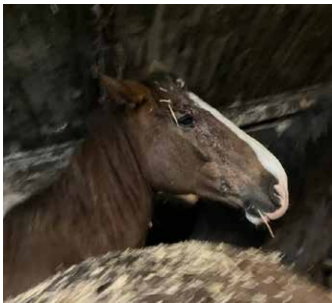
Det er tydeligt, at hestene ikke passes.

Desværre ser det rigtig skidt ud. De heste, der stod tilbage på Viegård er nu flyttet til ny adresse, hvor forholdene absolut heller ikke er i orden. Fødevestyrelsen kommer jævnligt forbi med påbud - senest den 7.1.25, hvor der ingen vand var, hestene går i lavtloftede bygninger, bliver ikke tilset for skader, flere heste er for tynde, heste kommer ikke ud og der står for mange heste på for lidt plads.