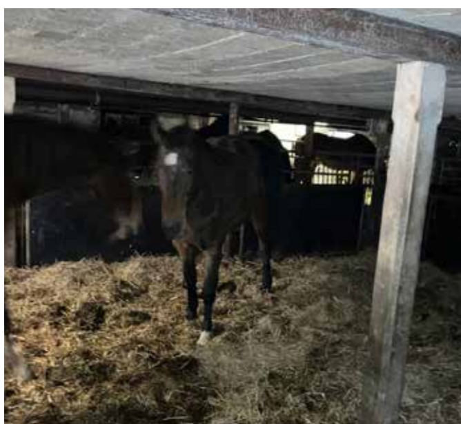
Hestene kan slet ikke stå oprejst.