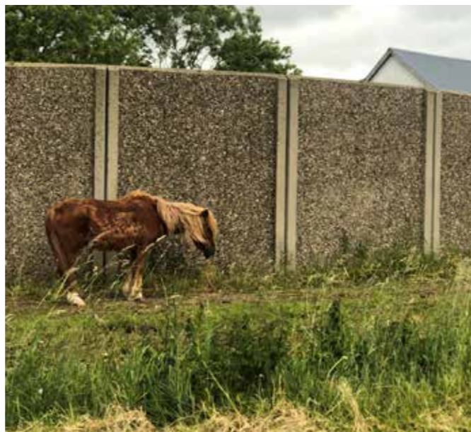
Endnu en stakkels, tynd og forhutlet hest.

Desværre ser vi ofte, det går rigtig galt, hvor ejer rammes af sygdom, og der sker et stort svigt af dyrene. Her skal de sociale myndigheder reagere, når de kommer ud til deres borgere. Vi har desværre oplevet mange gange, at der overhovedet ikke bliver reageret for det er jo synd for borgerne at fratage dem deres dyr. Men hvad med dyrene? De skal have samme hjælp som borgerne!!