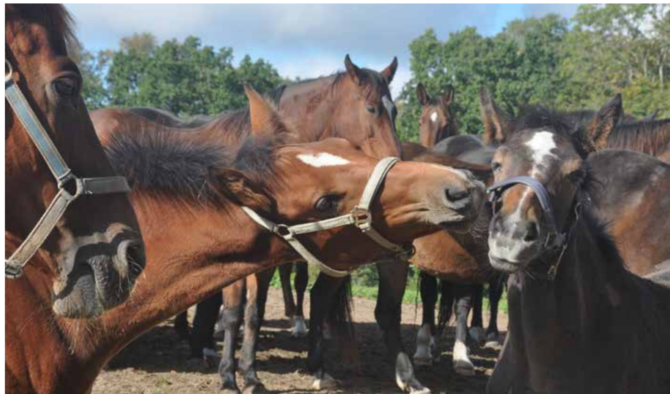
Oskar & Diamond leger