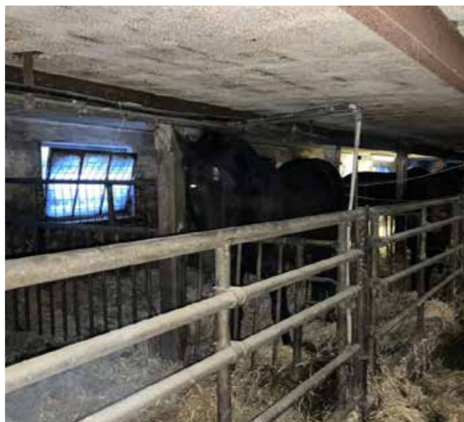
Der er kummerlige forhold.