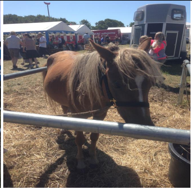
Denne ponyhoppe var utrolig apatisk og fuldstændig slukket. Den er blevet frikøbt og kan se frem til et godt liv.