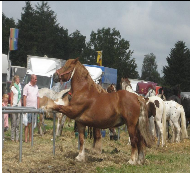
Stresset og i afmagt ved at stå bundet i flere dage og ikke kan komme væk