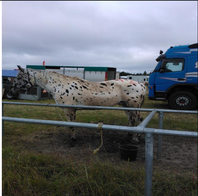
Denne knopstrupper var mærket – formodentlig solgt til slagting i udlandet