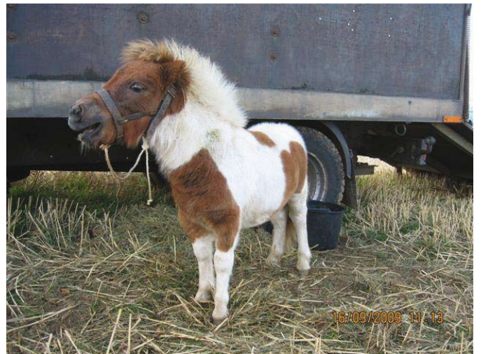
Et ulykkeligt føl, der skreg på sin mor, som sikkert var solgt