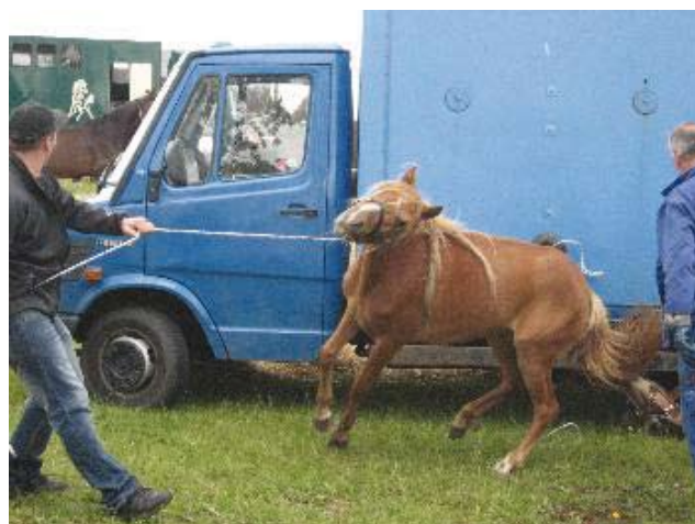
Hest i panik

Dyrlægen er ikke at finde på pladsen, og når han endelig er der, vil han ikke foretage sig noget. Det virker som om, det er hestehandlernes dyrlæge og ikke hestenes.