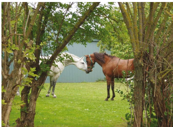
Savannah og Alarming – deres første møde

Alarming, som er en 14 års OX araber søgte nyt hjem, da tidligere ejer ikke havde den fornødne tid mere. Vi fandt en super familie til ham i Svendborg, hvor han nu går sammen med en 14 årig hoppe Savannah. Mødet mellem Alarming og Savannah gik fantastisk. Efter et kort øjeblik gik de to heste sammen, som om de havde været sammen hele livet. Savannah havde gået alene efter at have mistet en ven, så glæden blev ekstra stor ved igen at have en ven.