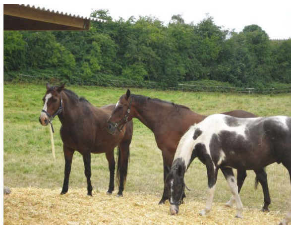
Talle, Legolas og Mickey

Kommer der svage heste ind, som har haft det rigtig skidt og udstråler noget trist, tager de gamle heste igen affære og hjælper den, hvis den ønsker hjælpen – og det gør de, hvis de er svage/unge/usikre.