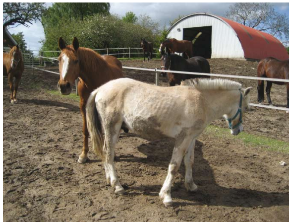
Line og Obelix

Hun beskyttede lille Obelix. Hun nød den korte tid, som det blev til, for Obelix kom relativt hurtigt i familiepleje.