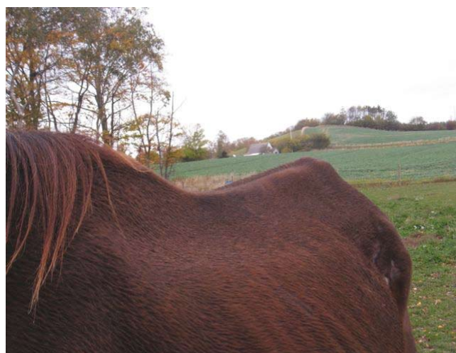
2009. Betsen på Langeland uden huld og nedsunkket i ryggen. Han har mistet al muskulatur.