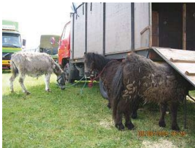
Utrivelige og usle ponyer

Hvordan kan markedsledelserne for hestemarkederne se sig selv i øjnene. Vil de virkelig lægge navn til de grusomheder, der foregår her?