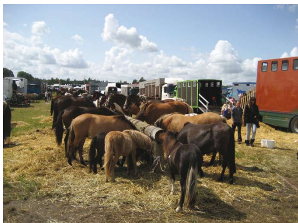
Affaldsheste en masse