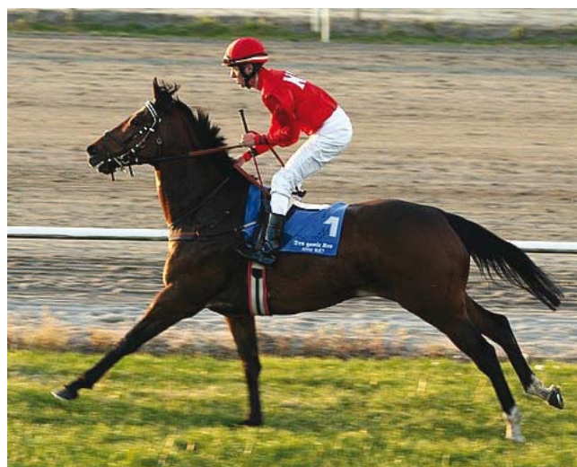
2008. Sådan så Betsen ud under løb for blot 1 år siden