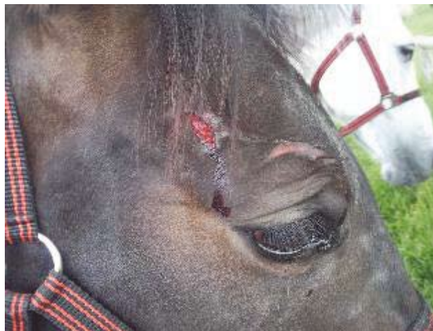
Sår og skrammer på grund af deres kolbøtter