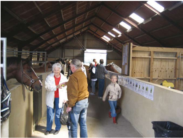
Tarzan nyder godt af alle godbidderne

Denne søndag holdt Nyt Hesteliv et kombineret åbent hus og loppemarked. Vi var heldige, at vejret var med os, og solen skinnede fra en skyfri himmel. Der kom cirka 100 besøgende, og vi begyndte med en rundvisning på området. Siden sidst havde vi fået endnu et læskur i ponyløsdriften, som nordbaggerne havde indtaget.