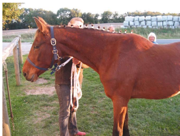
Lucky med flettet man på hestemarkedet, som camouflager