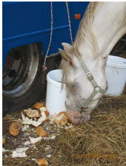
Sikke et måltid... (Billede: Hesteinternatet af 1999)