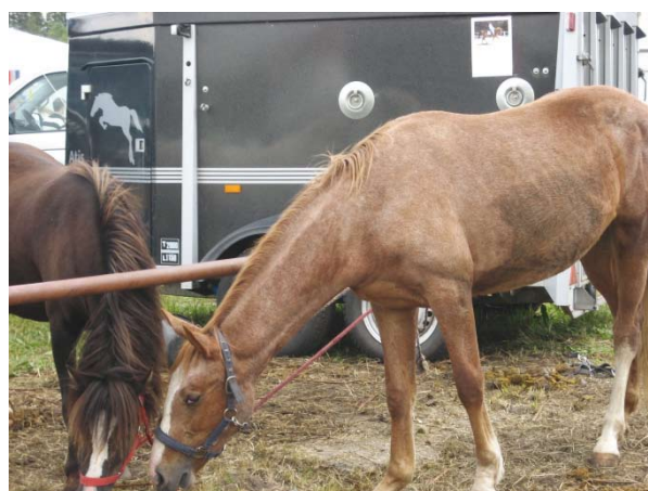
En udpint hest, der venter på sin videre destination