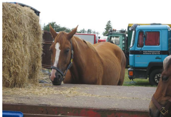
Udkørte heste, der var ved at falde sammen af træthed, de havde sandsynligvis kørt hele natten og måske mere til