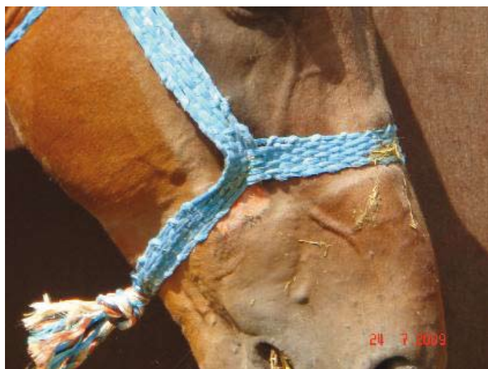
Nylongrime, der har skåret sig ind i huden på den arme hest

Vi har sendt pressemeddelelser ud til Justitsministeriet og alle dyrevelfærdsordførerne, som reagerer meget forskelligt. Vi afventer ministerens udtalelse/ kommentarer til vores pressemeddelelse. Jeg har tilbudt nogle af de ordførere, der har reageret, at tage vedkommende med på et hestemarked, så de ved selvsyn kan se, hvordan det foregår. Det håber vi bliver en realitet.