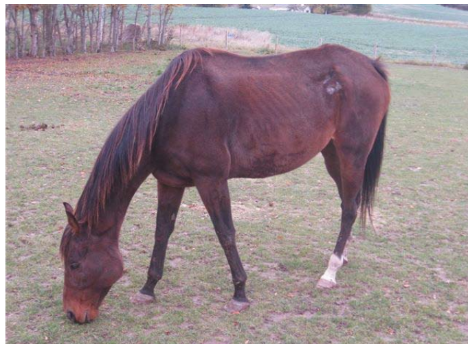
2009. Betsen på Langeland, vanrøgtet og med store liggesår på hoftebenet

Omvendt er en sag som denne endnu mere skidt for hesten end døden. Betsen blev reddet i sidste øjeblik.