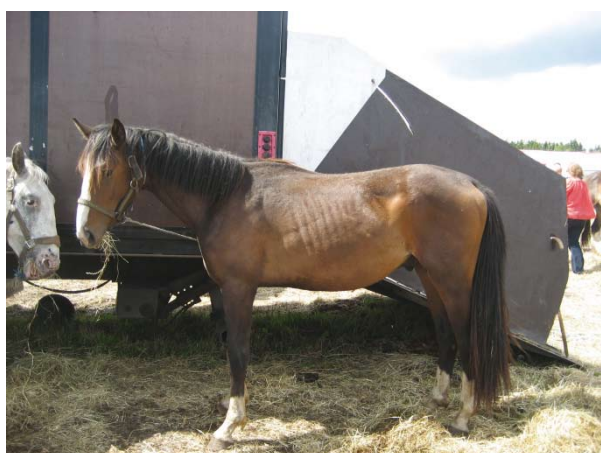
Tynd trist hest