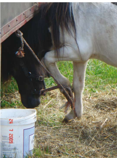
Typisk afmagt – viklet ind i nylonreb