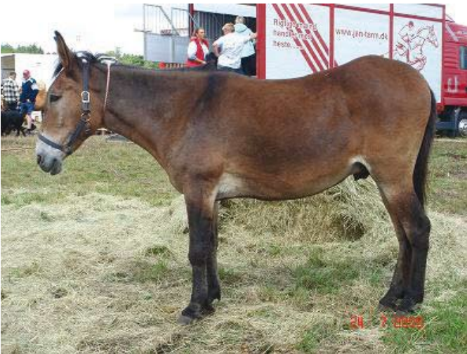
Trist muldyr venter på sin skæbne