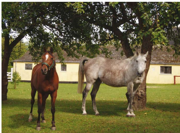
Alarming og Savannah

Alarming, som er en 14 års OX araber søgte nyt hjem, da tidligere ejer ikke havde den fornødne tid mere. Vi fandt en super familie til ham i Svendborg, hvor han nu går sammen med en 14 årig hoppe Savannah. Mødet mellem Alarming og Savannah gik fantastisk. Efter et kort øjeblik gik de to heste sammen, som om de havde været sammen hele livet. Savannah havde gået alene efter at have mistet en ven, så glæden blev ekstra stor ved igen at have en ven.