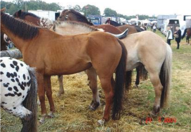
Slagteheste på tilbud