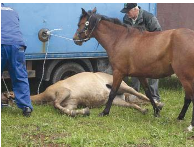
Hesten har nu opgivet og vil ikke rejse sig. Hestehandleren på billedet til højre står og sparker til den