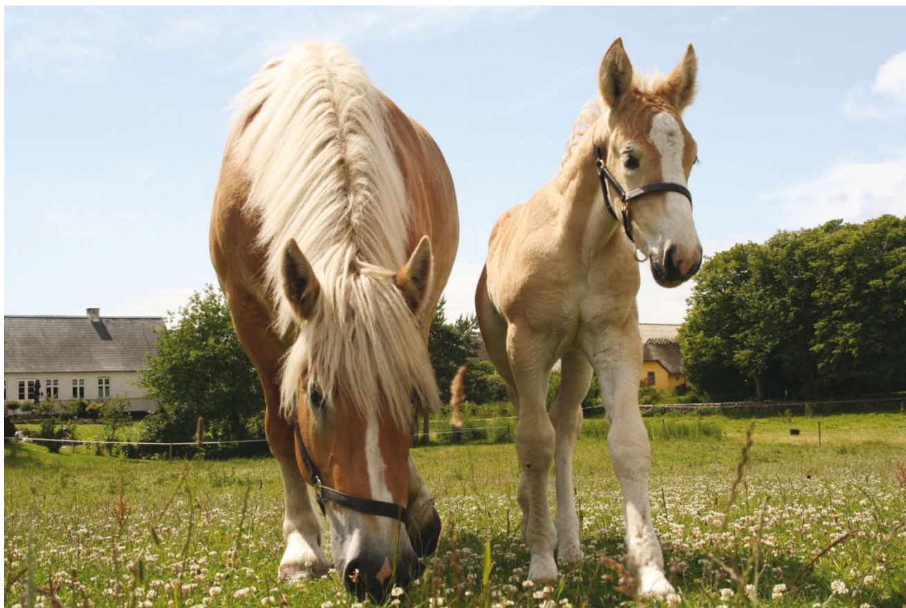
Frieda og Baronessen