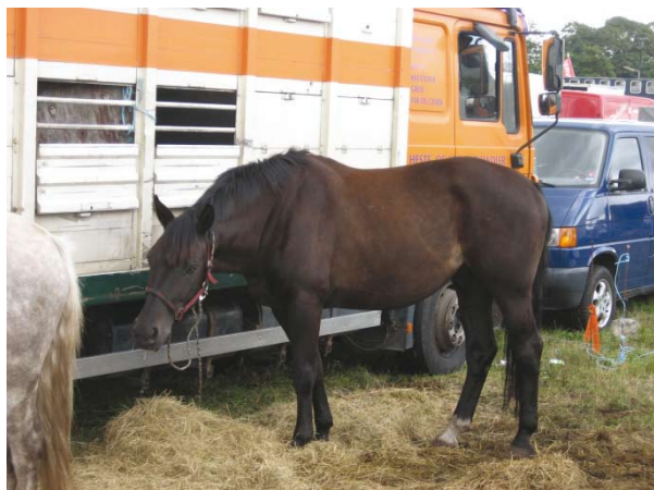
En tidligere ejer fandt chokeret sin gamle hest, som hun troede, hun havde solgt til et godt hjem