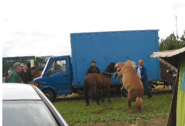
Hest i panik

Politiet griber ikke ind, især ikke når dyrlægen ikke foretager sig noget. Myndighederne er sat helt ud af spillet.