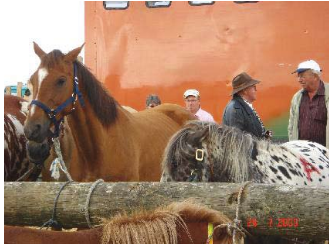
Mærkede heste til udenlandsk slagteopkøber