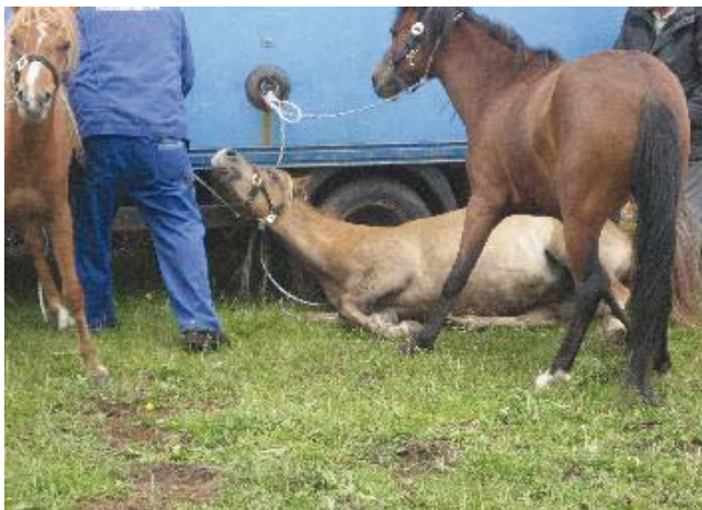
Hest i panik har slået en kolbøtte