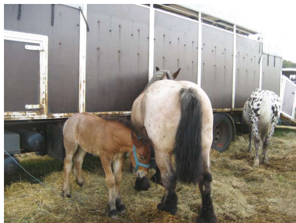
Et stakkels lille føl