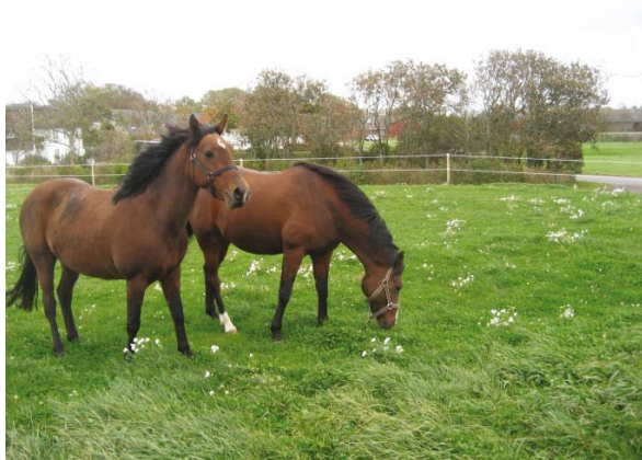
Tarzan (bagest) i sine nye omgivelser

NH Tarzan er en tidligere rideskolehest fra Holland, som blev købt af Nyt Hesteliv på Egeskov Heste marked i september 2008. Tarzan er en rigtig sød og omgængelig hest, som er god til børn. Det var en helt ny verden for ham at bo i løsdrift med mange heste, og det var tydeligt, at Tarzan havde problemer med at markere sine grænser. Han var lidt "robotagtig" i og med at han havde været vant til at blive flyttet rundt af mennesker og ikke havde haft et tæt socialt liv med andre heste. I begyndelsen holdt han sig meget for sig selv og selv om han, om natten, gik i gruppen med de "flinke" heste, blev han alligevel skubbet udenfor hallen. Derfor kom han i boks om natten, så han kunne slappe af.