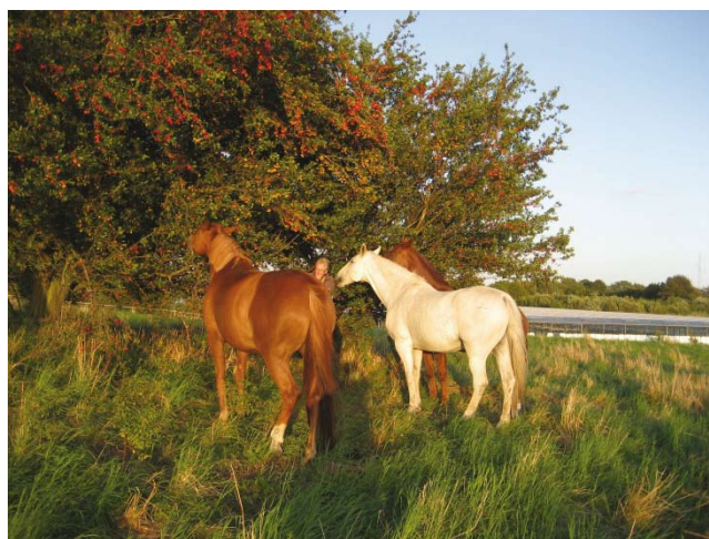
Zas (hvid) mellem sine 2 røde hopper

Det skabte en del hurlumhej i de første dage om, hvem der skulle føre flokken. I første omgang gik pensionæren Robin af med sejren og scorede også hoppen Firenze, som ellers går sammen med Masai. Romeo fra Vorbasse arbejdede kraftigt på sagen, var fræk og tog chancer, og rykkede højere op i hierarkiet. Vi var ude at kigge til hestene og fylde op med vand morgen og aften. Desuden havde Julie fået skadet sit øje og skulle dryppes. Efter 3 uger var begge foldene græsset ned, og så gik turen hjemad igen både i trailer og på hesteryg. Hestene var så hjemme 1 måneds tid og kom tilbage til Vissenbjerg de sidste 14 dage. Denne gang blev nordbaggerne hjemme, for de var simpelthen blevet så tykke, at de kunne trille. I mellemtiden havde vi modtaget en ny vallak, Zas, som efter sigende skulle være meget rolig og omgængelig. Vi oplevede ham dog i starten som meget hingstet. Og det viste sig så, at han i meget lang tid ikke havde gået sammen med hopper. Så kom han pludselig i paradiset, hvor det vrimgalede med hestegale hopper og de første dage hang Zas en stor del af tiden oppe på ryggen af en hoppe. Resten af tiden brugte han på at brøle, som en løve, og samle kræfter. Vi kunne ikke sætte ham ind i boks, da han så lagde an til at springe over lågen, for at komme ud til hopperne.