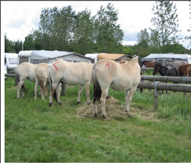
Mærkede og opkøbte heste til slagtning ?