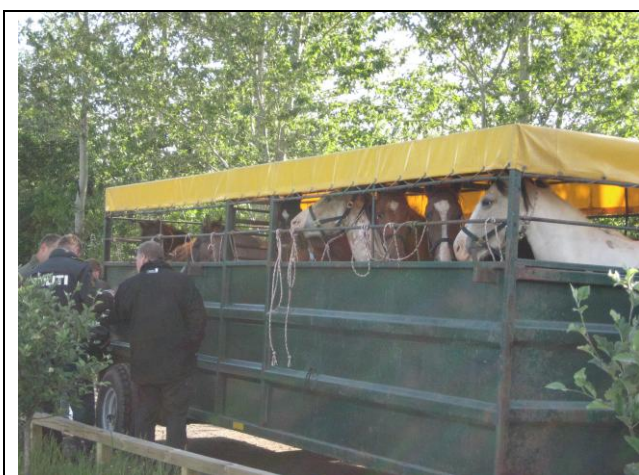
En traktor med alt for stort læs stuvet sammen

Der var politirazzia på Hjallerup marked i år. Det var rart at se. Der var en stor politistyrke, som stod klar ved indgangen til hestemarkedet. Alle lastbiler, anhængere og trailere med heste i blevet stoppet og undersøgt. De blev gennemgået for pas og chipmærkning, og om hestene så ud til at være i orden. Fuldstændig som vi har oplevet det på Egeskov Hestemarked gennem de sidste 3 år. Det er de samme hestehandlere, der kommer på alle hestemarkeder, så de kender rutinen. Der kom en traktor ind på markedet med en anhænger fuld af heste, der stod alt for tæt. Se billederne nedenfor.