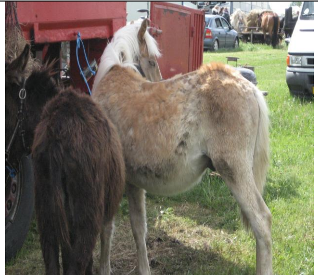
En trist og tynd plag og tynde æsler