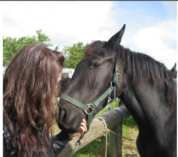
En trist hest, der bad om hjælp.....