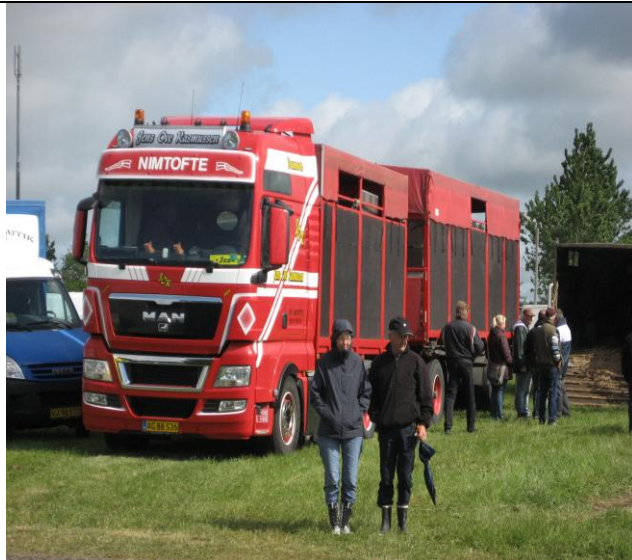
En tom bil, der stod der kl. 07.00 fredag morgen. Hvem skal med og hvor mon den skal hen?