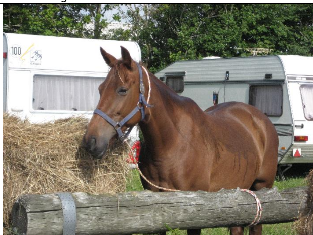
En fin ældre hest, der sikkert engang har haft en sød ejer – men nu er den kasseret som affald