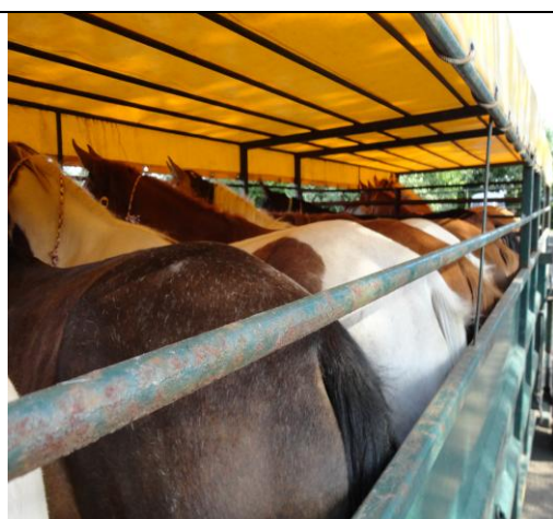
Samme læs set bagfra