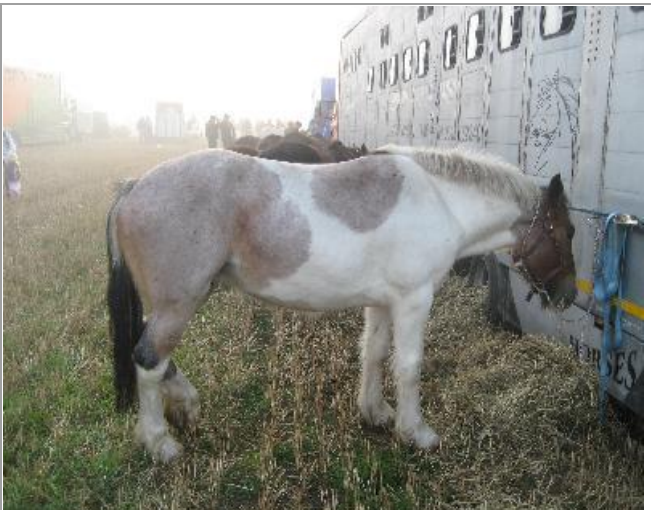
Den var meget bange, og den ville vi også godt have haft med hjem. Når man nærmede sig den, sitrede den.