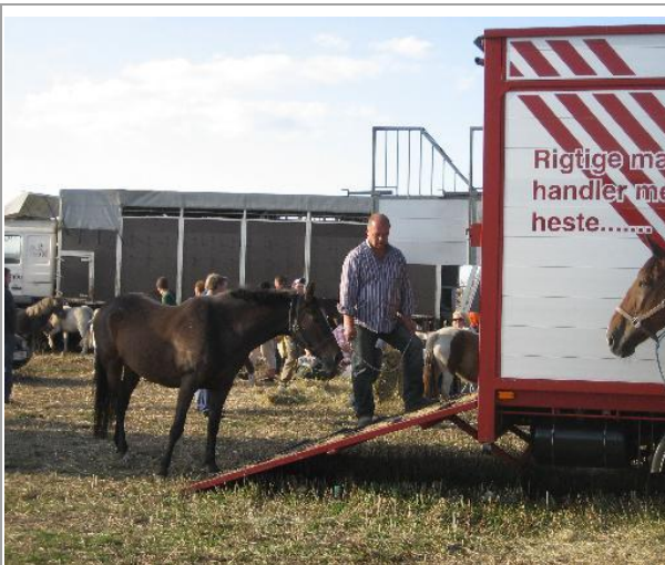
Denne hoppe skulle have været med den italienske bil. Den ville ikke læsses. Den blev til sidst stukket med en møggreb og tja, så kom den op til sidst. Gud ved hvad der er sket med den nu??