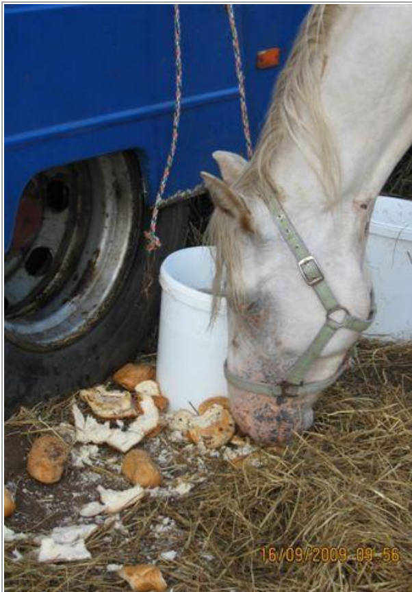
Så er der mad - "spændende" hvidt brød.