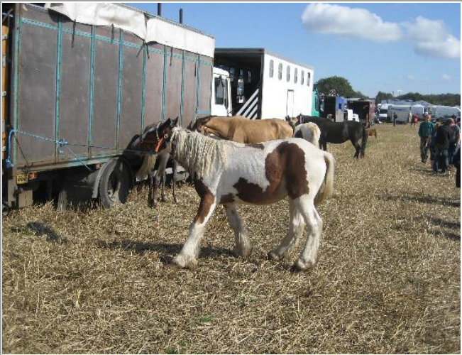
En ked hest, der forsøgte at rive sig løs