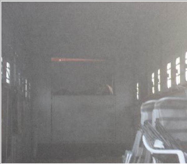
Bagest stod 2 røde ponyer indespærret på den italienske lastbil hele dagen på Egeskov