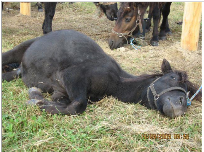
Træt af alle strabadserne.