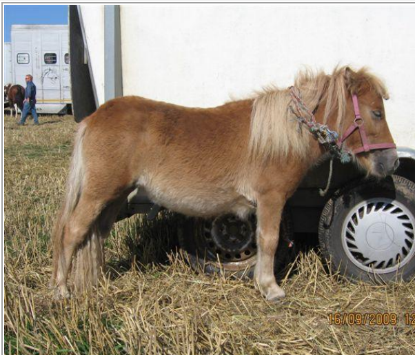
Rigtig træt.