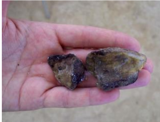
Foto 1: En stor smegmasten som denne kan bestemt give hesten stor ubehag

Tjek for smegmasten: Hingstes og vallakkers hygiejne