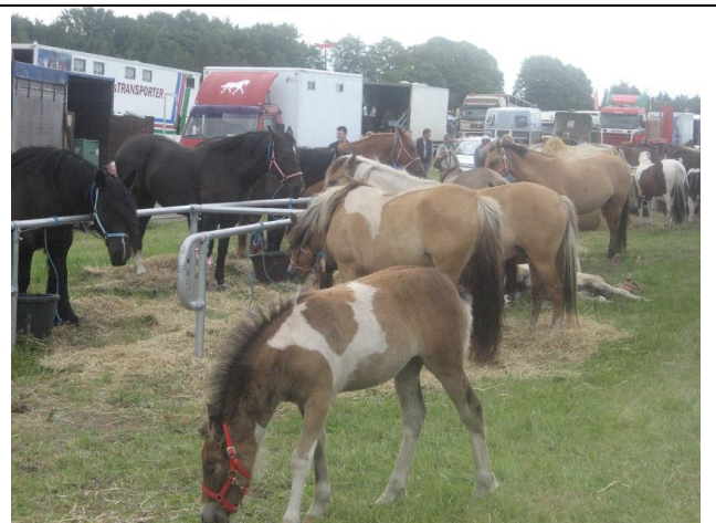
Vorbasse 2011 – Spækket med biler og heste