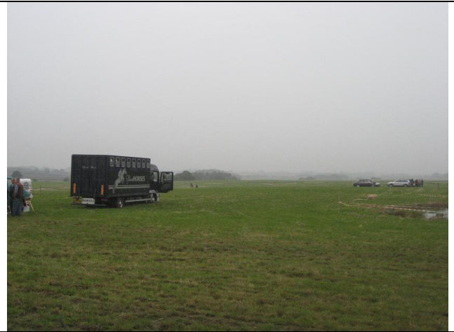
Egeskov 2011 – kl. 08.00 – næsten tomt